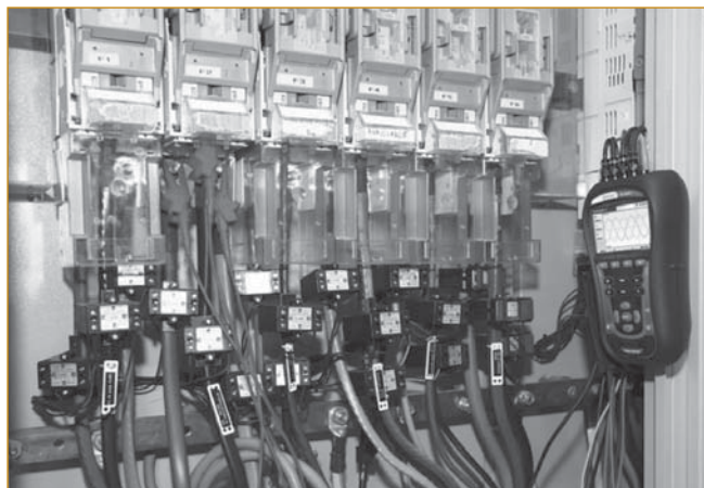
Рис. 1. Инструментальное обследование оборудования электрических сетей

2. Формирование единого электронного каталога оборудования и электроприемников электрических сетей; схем нормального режима электрических сетей всех уровней напряжения.